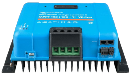
Контроллер заряда SmartSolar MPPT 150/100-Tr VE.Can без экрана