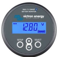
Bluetooth-датчик: BMV-712 Smart Battery Monitor