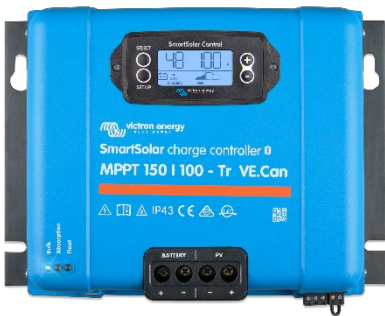
Контроллер заряда SmartSolar MPPT 150/100-Tr VE.Can с опциональным подключаемым экраном