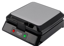
Waffle Maker AD 3036