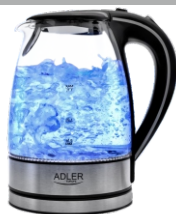
Electric Kettle AD 1225