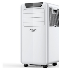
Air Conditioner AD 7916