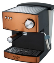
Espresso Machine AD 4404