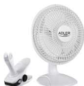
Desk fan 15 cm with clip AD 7317