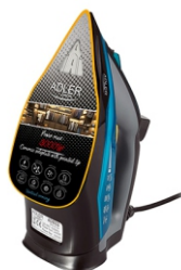
Steam Iron AD 5032