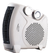
Fan Heater AD 77