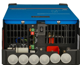
MultiPlus 2000 BA (нижняя крышка снята)