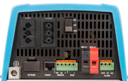
MultiPlus 500 / 800 / 1200 / 1600 BA