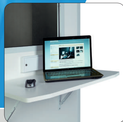
Складний столик на панель підключень