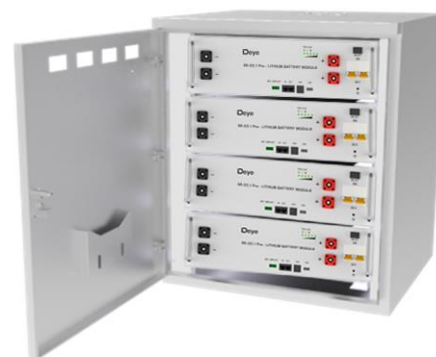
Встановлення в стійку