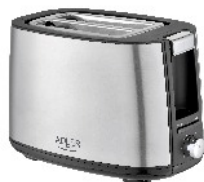
TOASTER 2 SLICE AD 3214