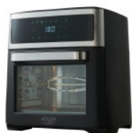
AIR FRYER OVEN AD 6309