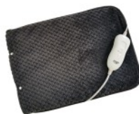
HEATED PAD AD 7433