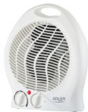
FAN HEATER AD 7728