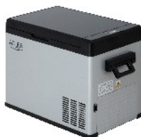
PORTABLE FRIDGE AD 8077