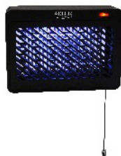
MOSQUITO LAMP AD 7938