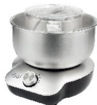
MIXER WITH BOWL AD 4222