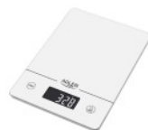
KITCHEN SCALE AD 3170