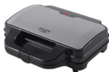
SANDWICH MAKER AD 3043