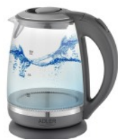
ELECTRIC KETTLE AD 1286