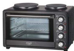
Electric Oven With HOB AD 6020