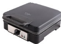
WAFFLE MAKER AD 3049