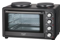
Electric Oven With HOB AD 6020