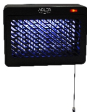
MOSQUITO LAMP AD 7938