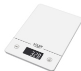
KITCHEN SCALE AD 3170