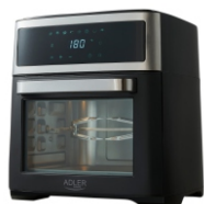
AIR FRYER OVEN AD 6309