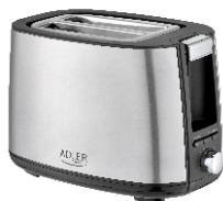
TOASTER 2 SLICE AD 3214