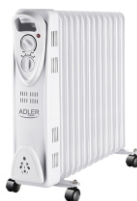
OIL-FILLER RADIATOR AD 7811