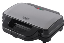
SANDWICH MAKER AD 3043