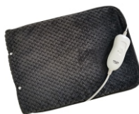
HEATED PAD AD 7433