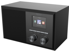
INTERNET RADIO CR 1180