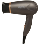
HAIR DRYER CR 2261