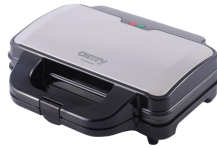
SANDWICH MAKER CR 3054