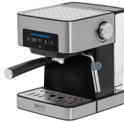
ESPRESSO MACHINE CR 4410