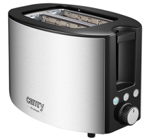
TOASTER 2 SLICES CR 3215