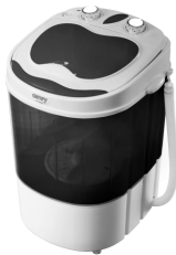
WASHING MACHINE CR 8054