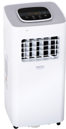
AIR CONDITIONER CR 7926