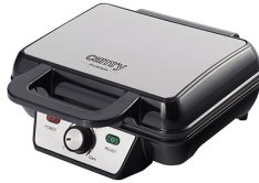
WAFFLE MAKER CR 3046