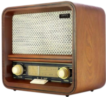
RETRO RADIO CR 1188