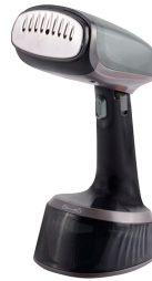
GARMENT STEAMER CR 5033