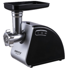
MEAT MINCER CR 4812