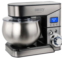
FOOD PROCESSOR CR 4223