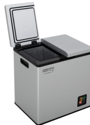
PORTABLE FRIDGE CR 8076