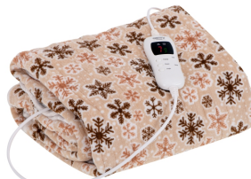
HEATING UNDERBLANKET CR 7430