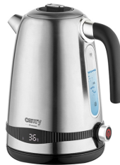
ELECTRIC KETTLE CR 1291