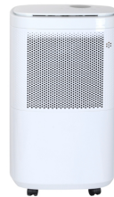
AIR DEHUMIDIFIER CR 7851