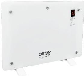
GLASS HEATER CR 7721