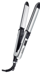
HAIR STRAIGHTENER CR 2320