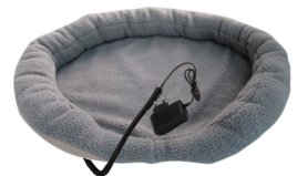
HEATED ANIMAL DEN CR 7431