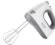
MIXER CR 4220