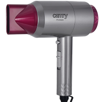
HAIR DRYER CR 2256