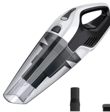
BAGLESS VACUUM CLEANER CR 7046