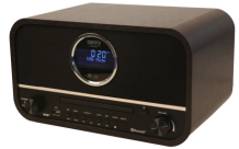
RETRO RADIO CR 1182