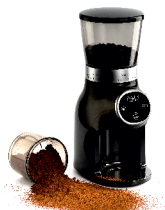
Burr Coffee Grinder AD 4450