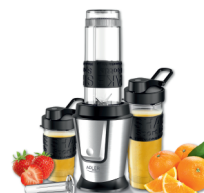
PERSONAL BLENDER AD 4081