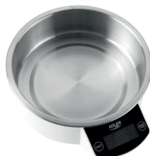
KITCHEN SCALE AD 3166