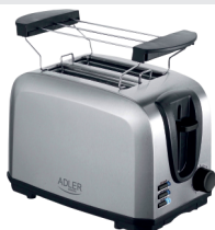
TOASTER 2 SLICE AD 3222