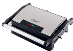
ELECTRIC GRILL AD 3052