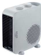
FAN HEATER AD 7725