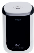
AIR HUMIDIFIER AD 7966