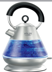
Electric Kettle AD 1282