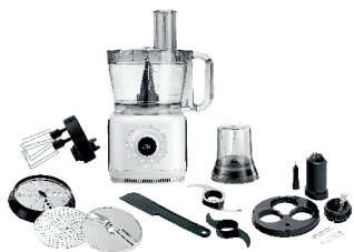
FOOD PROCESSOR AD 4224