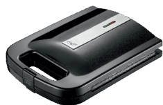
Sandwich Maker AD 3055