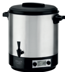
PASTEURIZATION POT AD 4496