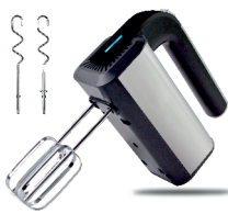
MIXER AD 4225