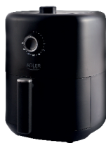
AIR FRYER AD 6310