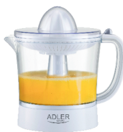
CITRUS JUICER AD 4009