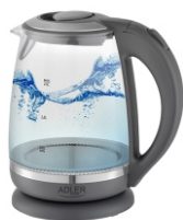
ELECTRIC KETTLE AD 1286