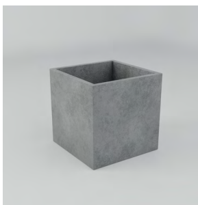
ВЕРОНА L: • 800 x 800 x 800 mm • Склопластик: 38 050 UAH