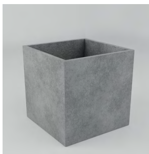
ВЕРОНА XL: • 1000 x 1000 x 1000 mm • Склопластик: 49 200 UAH