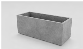
ЛІСАБОН XL: • 400 x 1000 x 400 mm • Склопластик: 20 500 UAH