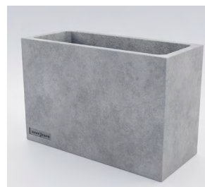
КАДІС L: • 530 x 800 x 350 mm • Склопластик: 20 000 UAH