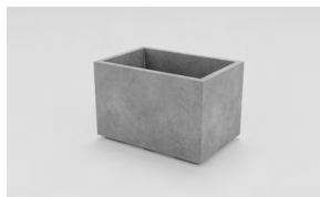
ЛІСАБОН M: • 400 x 600 x 400 mm • Склопластик: 13 200 UAH