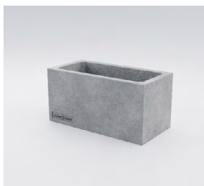
КАДІС S: • 300 x 600 x 300 mm • Склопластик: 9 750 UAH