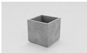
ЛІСАБОН S: • 400 x 400 x 400 mm • Склопластик: 10 665 UAH