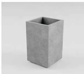
СІДНЕЙ S: • 570 x 350 x 350 mm • Склопластик: 11 550 UAH