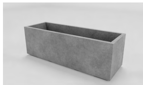
ЛІСАБОН 2XL: • 400 x 1200 x 400 mm • Склопластик: 24 850 UAH