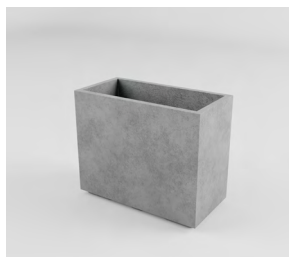
СІДНЕЙ M: • 570 x 700 x 350 mm • Склопластик: 18 750 UAH