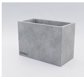
КАДІС M: • 490 x 700 x 350 mm • Склопластик: 16 450 UAH