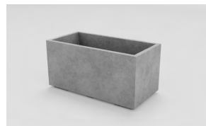
ЛІСАБОН L: • 400 x 800 x 400 mm • Склопластик: 16 550 UAH