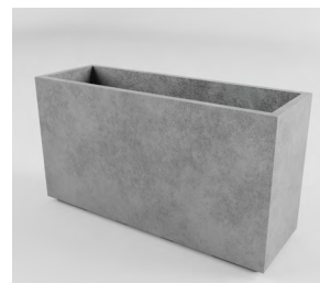
СІДНЕЙ L: • 570 x 1050 x 350 mm • Склопластик: 24 700 UAH