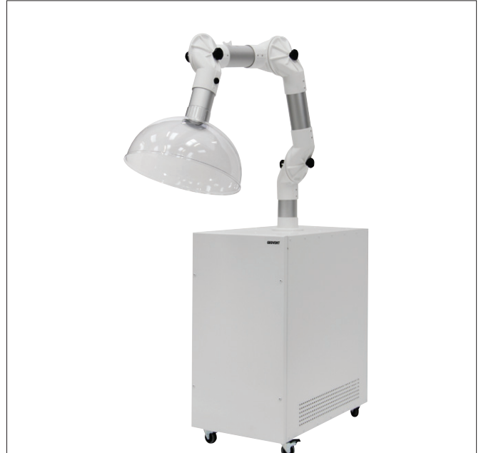
GeoGo Mini - White line

Цей вид відсмоктування зменшує рівень забруднюючих речовин, на які наражаються пацієнти, стоматологи та інші особи.