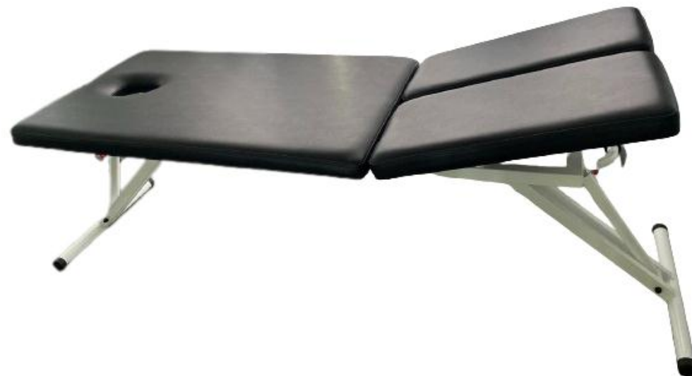
Масажний стіл МТВ-051