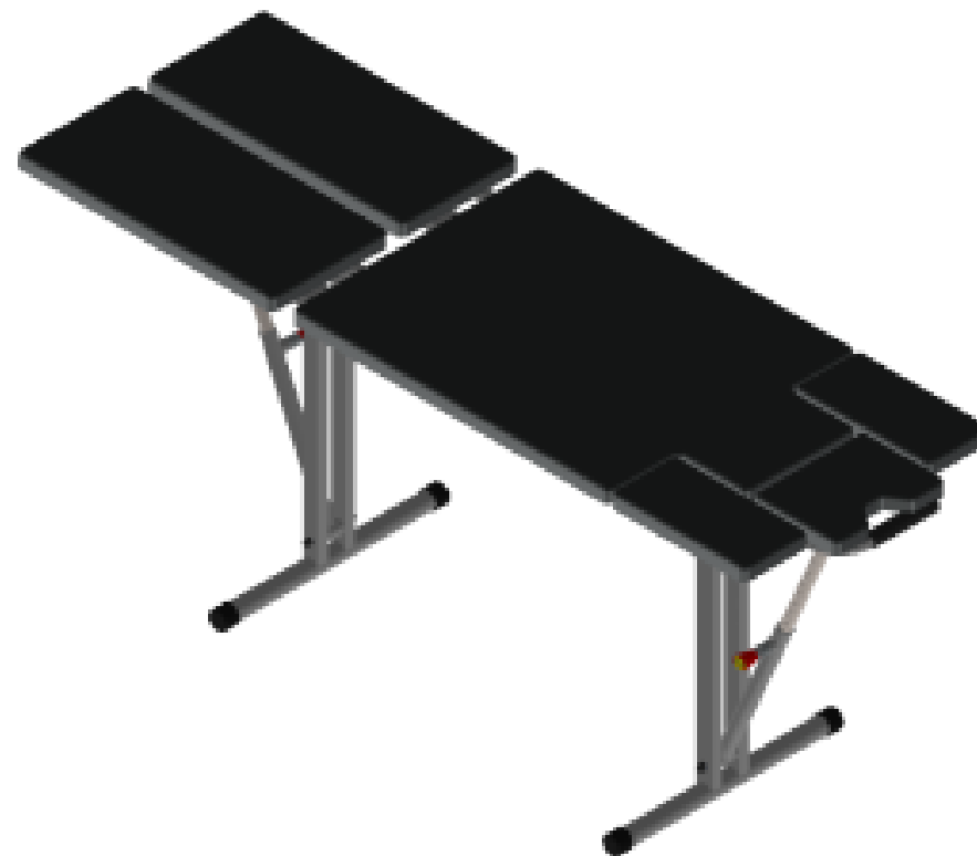
Масажний стіл МТВ-050