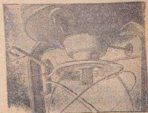
Рис. 3 Нера- бочее положение ночного рычага в прорези замка.

Вращением стержня 8 вправо (рис. 3) поднять фильтр и зажечь через прорезь колпачка 7 (рис. 3). Затем вы- вести рычаг 4 из прорези замка и главно опустить стекло со стеклодер- жателем вниз и отрегулировать пла-