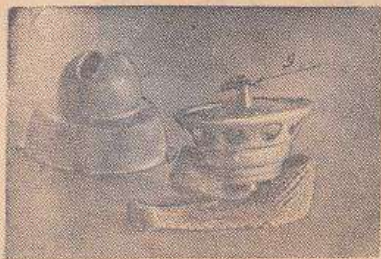
Рис. 7 Металлическая пластинка горелки

г) перекрытия верхних прорезей фонаря (не рекомендуется фонарь прижимать к себе).