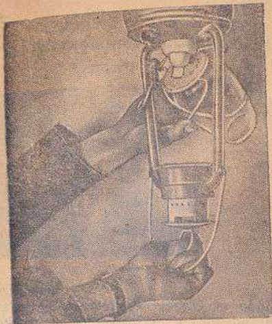
Рис. 4. Очистка стекла от верхнего прижимного узла.

плану сторону от себя, в верхний узел главно опустить вниз.