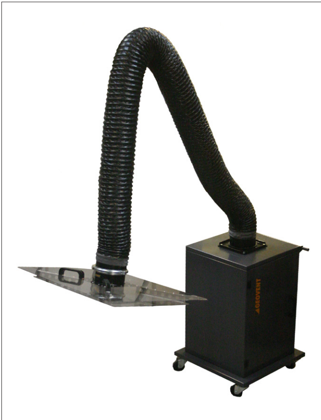
Цей пристрій оснащений повітрязабірником для видалення парів клею

Кронштейн підбирається відповідно до завдання і може поставлятися з швидкознімним з'єднанням, що дозволяє швидко замінити витяжний ковпак, насадку або витяжку для видалення клейового диму в разі потреби.