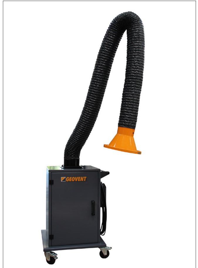
З витяжним зондом для зварювання

Витяжний вентилятор поставляється в комплекті з двигуном 1,1 kW на 3x400V з кабелем 10 м, ЕХ-виконання, а також витяжним рукавом 2 x 5 м, \varnothing 200 мм. Максимальний потік повітря: 800 - 1100 м 3 /год.