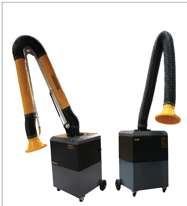
GeoGo з ASA-4 рукав, ESA рукав, або WING рукав