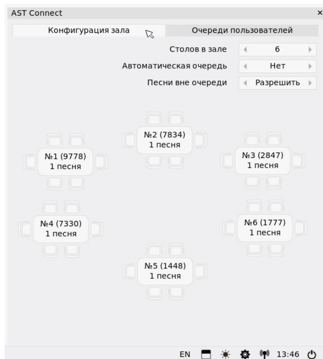
Рис. 1 Конфигурация зала

Виджет «AST Connect» предназначен для управления заказами и очередностью исполнений песен. Очередь формируется на основании заявок, поданных посетителями с помощью мобильного приложения. Работа «AST Connect» возможна только в режиме «Клуб».