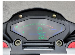
Электронная панель приборов