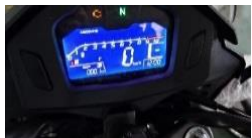
Электронная панель приборов