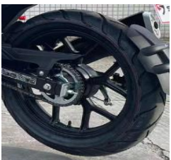
Дорожный протектор шин