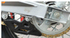
Новый усиленный рычажный механизм