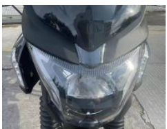
Фара галогеновая с LED габаритами