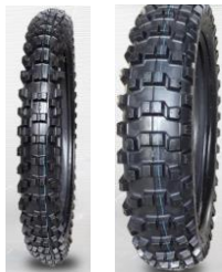
Протектор шин Kenda