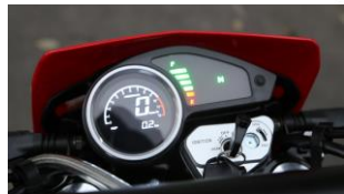
Электронная панель приборов