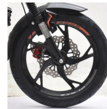
5-спицевый легкосплавный диск