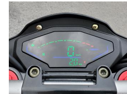
Электронная панель приборов