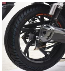
Дорожный протектор шин