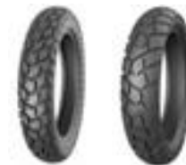
Протектор шин Yuanxing