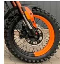
Диск на спицах