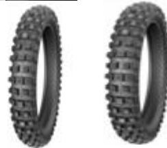
Протектор шин Yuanxing