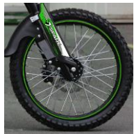
Диск на спицах