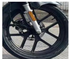
5-спицевый легкосплавный диск