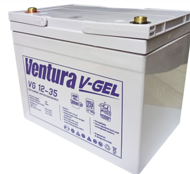
Габаритні розміри, мм