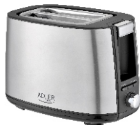
TOASTER 2 SLICE AD 3214