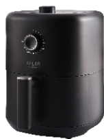
AIR FRYER AD 6310