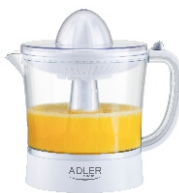
CITRUS JUICER AD 4009