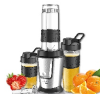
PERSONAL BLENDER AD 4081