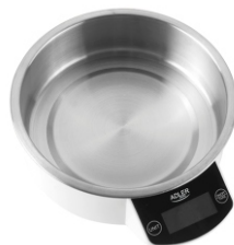
KITCHEN SCALE AD 3166