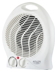
FAN HEATER AD 7728