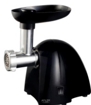
MEAT MINCER AD 4811