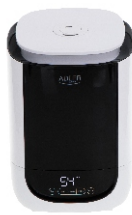
AIR HUMIDIFIER AD 7966