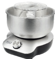
MIXER WITH BOWL AD 4222