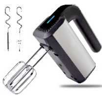
MIXER AD 4225