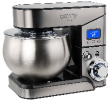
FOOD PROCESSOR CR 4223