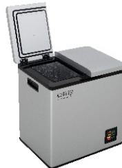
PORTABLE FRIDGE CR 8076