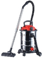
VACUUM CLEANER CR 7045