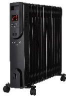
OIL FILLED RADIATOR CR 7814