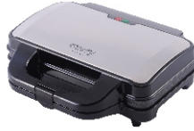
SANDWICH MAKER CR 3054