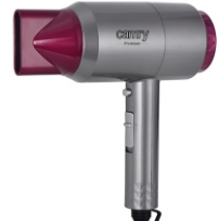
HAIR DRYER CR 2256