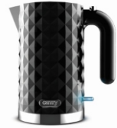
Electric Kettle CR 1169