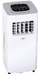
AIR CONDITIONER CR 7926