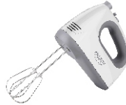
MIXER CR 4220