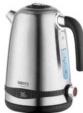
ELECTRIC KETTLE CR 1291