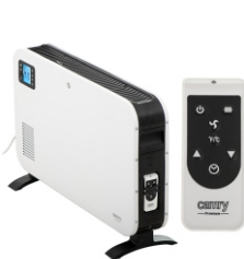
CONVECTION HEATER CR 7724