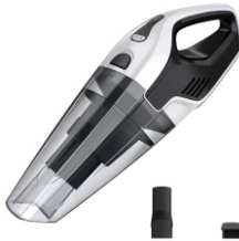
BAGLESS VACUUM CLEANER CR 7046