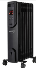
OIL FILLED RADIATOR CR 7812