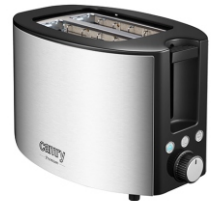
TOASTER 2 SLICES CR 3215