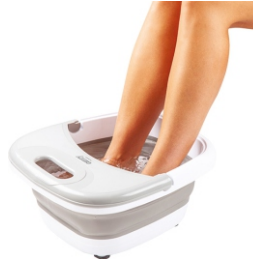
FOOT SPA CR 2174