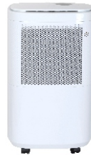
AIR DEHUMIDIFIER CR 7851