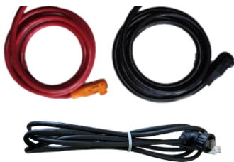
Модель: Кабель RW-M6.1-P

Деталі: Пара кабелю живлення постійного струму 4AWG та комунікаційного кабелю RJ45 з'єднуються з гібридним інвертором, один кінець має водонепроникну клему. Довжину кабелю можна змінювати відповідно до вимог замовника, довжина за замовчуванням становить 1500 мм.