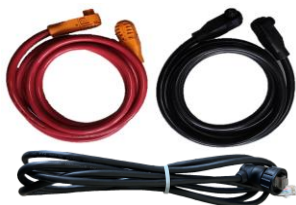
Модель: Кабель RW-M6.1-B

Деталі: Пара кабелю живлення постійного струму 4AWG та комунікаційного кабелю RJ45 з'єднуються з гібридним інвертором, один кінець має водонепроникну клему. Довжину кабелю можна змінювати відповідно до вимог замовника, довжина за замовчуванням становить 1500 мм.