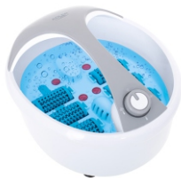
FOOT SPA AD 2177