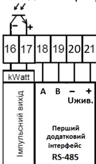
Рисунок 2 – Схема підключення інтерфейсів лічильника

3.2 Схеми підключення інтерфейсів лічильника наведена на рисунку 2 відповідно до таблиці виконань 2.2.