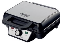
WAFFLE MAKER CR 3046