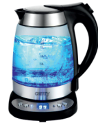
ELECTRIC GRILL CR 3044