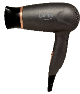
HAIR DRYER CR 2261