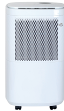
AIR DEHUMIDIFIER CR 7851