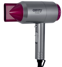
HAIR DRYER CR 2256