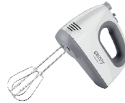
MIXER CR 4220