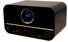
RETRO RADIO CR 1182