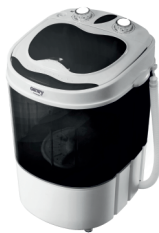
WASHING MACHINE CR 8054