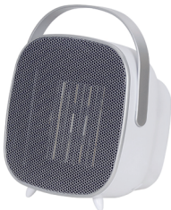
CERAMIC FAN HEATER CR 7732