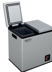
PORTABLE FRIDGE CR 8076