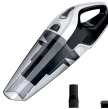
BAGLESS VACUUM CLEANER CR 7046