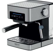
ESPRESSO MACHINE CR 4410