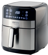
AIR FRYER OVEN CR 6311