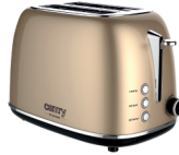
TOASTER 2 SLICES CR 3217