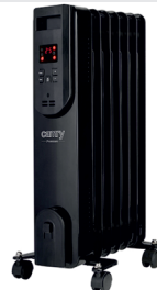
OIL FILLED RADIATOR CR 7812