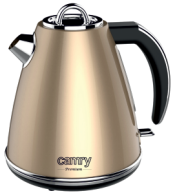
ELECTRIC KETTLE CR 1292