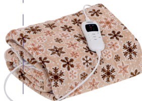
HEATING UNDERBLANKET CR 7430