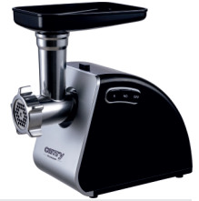
MEAT MINCER CR 4812