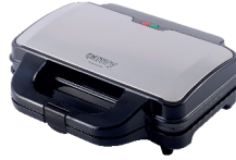
SANDWICH MAKER CR 3054