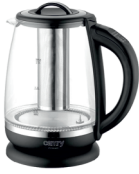
ELECTRIC KETTLE CR 1290