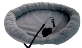
HEATED ANIMAL DEN CR 7431