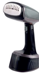
GARMENT STEAMER CR 5033