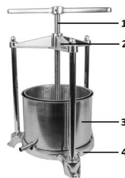
Model no. 810505