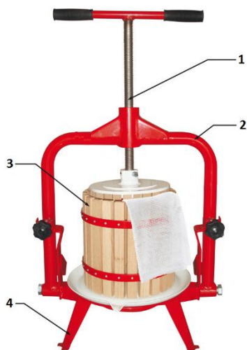
Model no. 810006, 810015, 810018