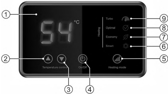
Малюнок 2. Електронна панель управління

1 - LCD дисплей, 2 - кнопка "▲" Temperature control / збільшення температури нагріву, 3 - кнопка "▼" Temperature control / зменшення температури нагріву, 4 - кнопка "On/Off" / вкл./викл, 5 - кнопка "Heating mode" / установка потужності нагріву - режиму роботи, 6 - індикація розумного режиму «Smart», 7 - індикація "Economy" / Мінімальна потужність, 8 - індикація "Optimal" / стандартна потужність, 9 - індикація "Turbo" / максимальна потужність.