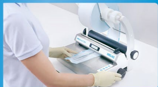
✓ Упаковка з MELAseal або MELAstore