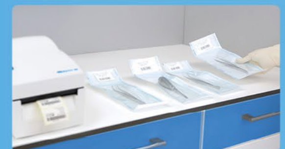
✓ Маркування з MELAprint 80