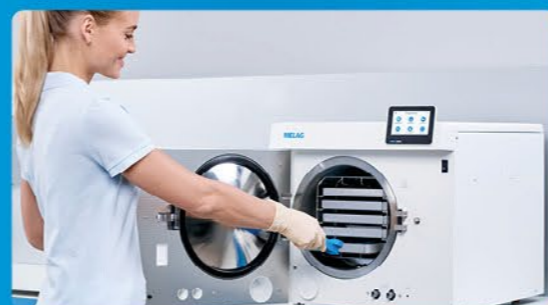
✓ Парова стерилізація з Vacuclave