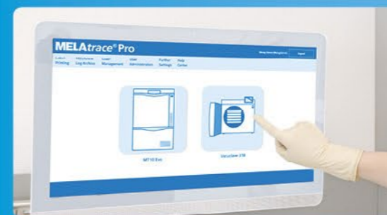
✓ Документація та погодження з MELAtrace