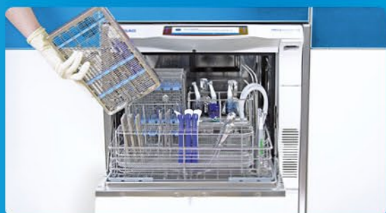
✓ Очищення та дезінфекція з MELAtherm