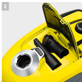
2 Держатели для принадлежностей