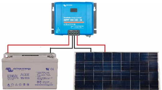
Рисунок 1: Силовые подключения