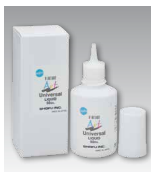
Vintage Art Universal Liquid 50 мл - Номер P0695