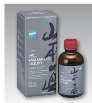
Yamamoto Liquid 50 мл, с пипеткой Номер P1695