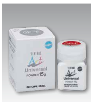
Glazing Powder GP-F 15 г - Номер P0693 50 г - Номер P0694