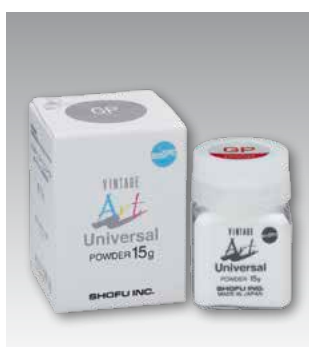
Glazing Powder GP 15 г - Номер P0691 50 г - Номер P0692