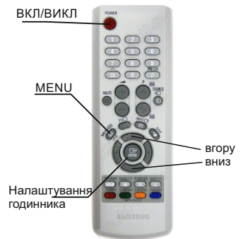
ІЧ - ПУЛЬТ