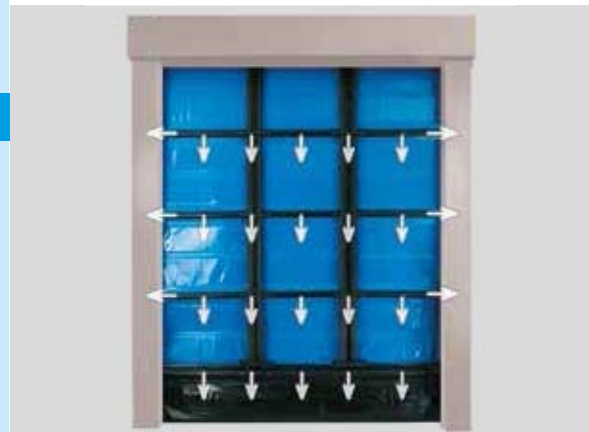
> Розподіл тиску та ущільнення