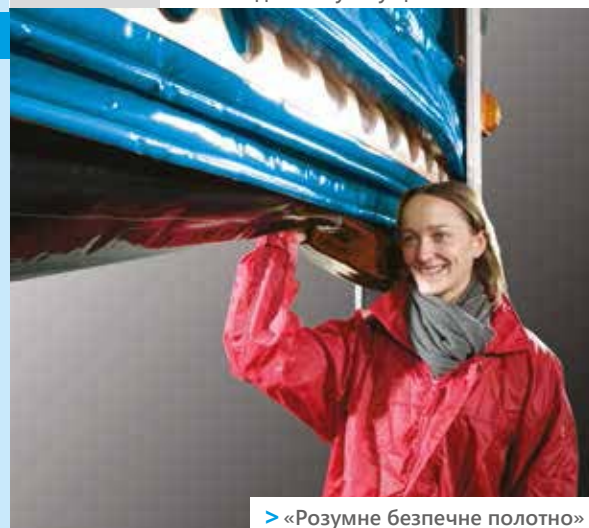
> «Розумне безпечне полотно»