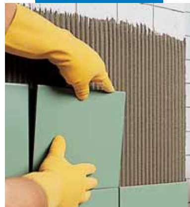
Нанесение поверх старой плитки