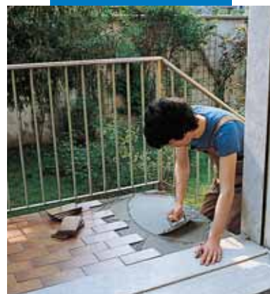
Гидроизоляция и укладка плитки с помощью смеси Kerabond T + Isolastic