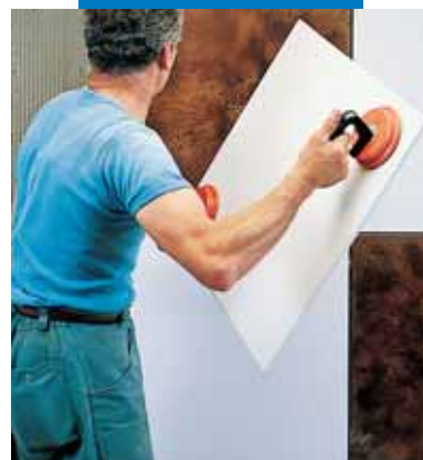
Укладка Keraion на стену