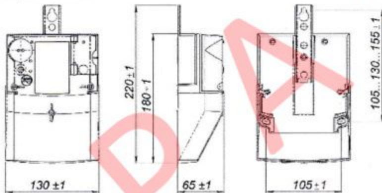
Рис. 2. Габаритні та установчі розміри лічильника