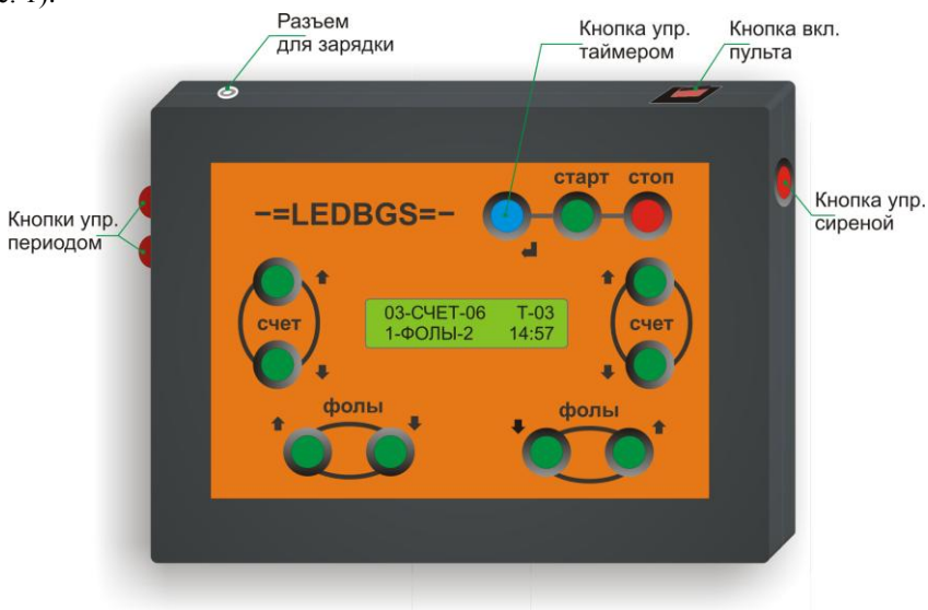
Рис. 1 – Пульт управления ЭТ

Управление ЭТ осуществляется с помощью беспроводного пульта (см. рис. 1).