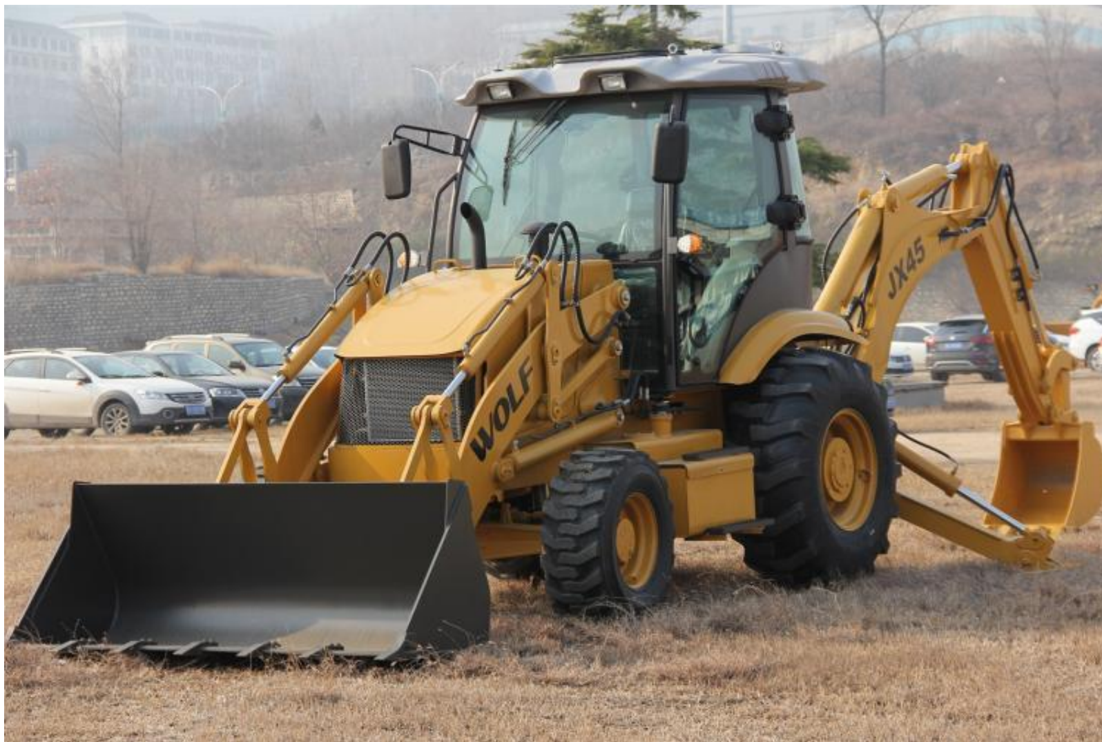
Екскаватор навантажувач JX 45