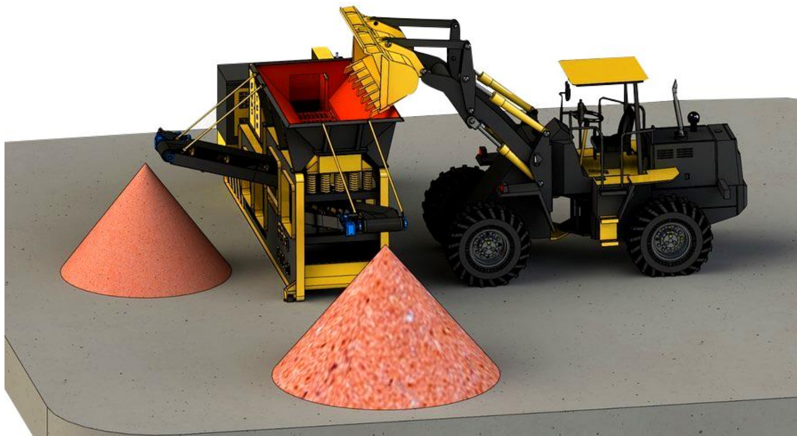
СТС-60 ЩЕКОВАЯ ДРОБИЛКА КОНТЕЙНЕРНОГО ТИПА