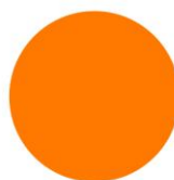
ПОМАРАНЧЕВА RAL 2004