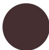
КОРИЧНЕВА RAL 8017