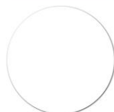
БІЛА (БАЗА А)