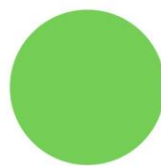
СВІТЛО-ЗЕЛЕНА RAL 6018