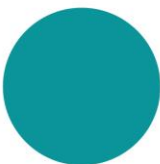
БІРЮЗОВА RAL 5018