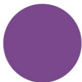
ФІОЛЕТОВА RAL 4001