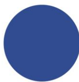
СИНЯ RAL 5005