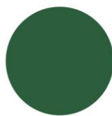
ЗЕЛЕНА RAL 6005