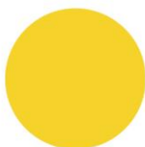
ЖОВТА RAL 1021