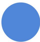
ЯСКРАВО-БЛАКИТНА RAL 5015