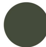
ХАКІ-ОЛИВА RAL 6006