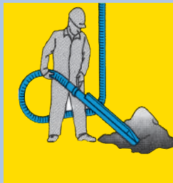
Вакуумный сбор и транспортировка материала