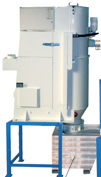
Дисковый затвор. Выгрузка в открытый контейнер. Требуется остановка системы.

Система автоматической регенерации фильтра AirShock® - гарантирует постоянную силу всасывания и избавляет от необходимости готовить и подводить сжатый воздух.