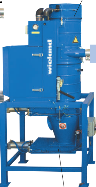
Двойной сдвижной затвор. Постоянная или периодическая выгрузка собранного материала.