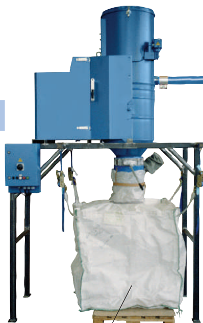
Выгрузка в мешки Биг-Бэг. Собранный материал упакован в мешки и готов для транспортировки.