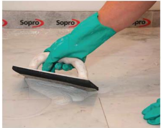
8 Затирка розчином Sopro DF 10® природного каменю, чутливого до фарбування