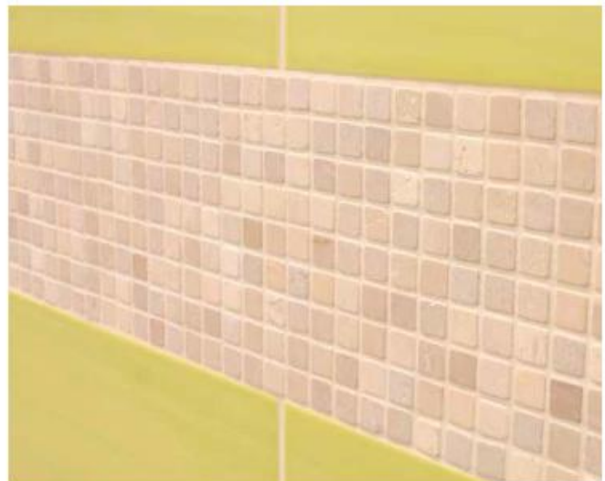
10 Поверхні, облицьовані керамічною плиткою і кам'яною мозаїкою і затерті Flex Sopro DF 10®.