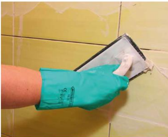
9 Затирка настінних керамічних плиток розчином Sopro DF 10®.