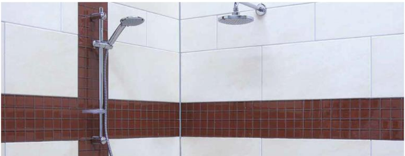
11 Облицьовання ванної кімнати, затерте затиркою Sopro DF 10®.