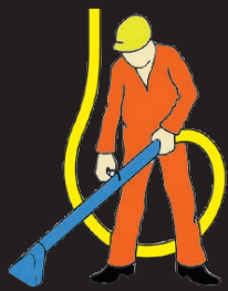
Уборка в цехах