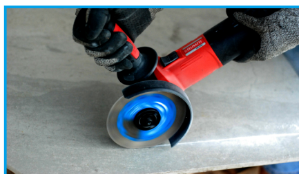
Резка керамической плитки