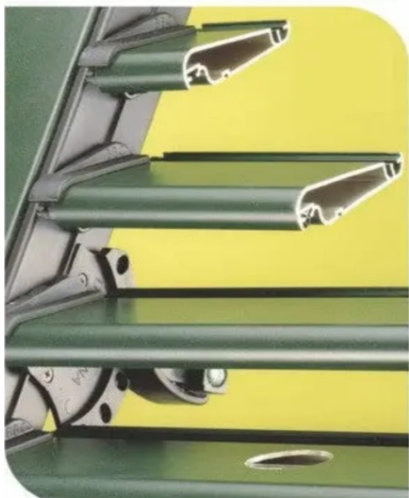
Поворотний механізм без прошивки прутом