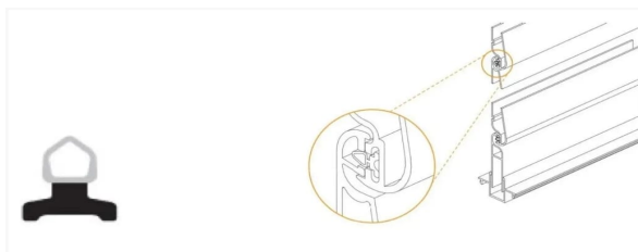
Ущільнювач для ламелі 66*16