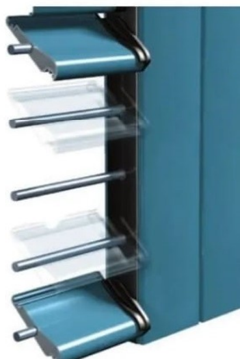
Поворотний механізм з прошивкою прутом