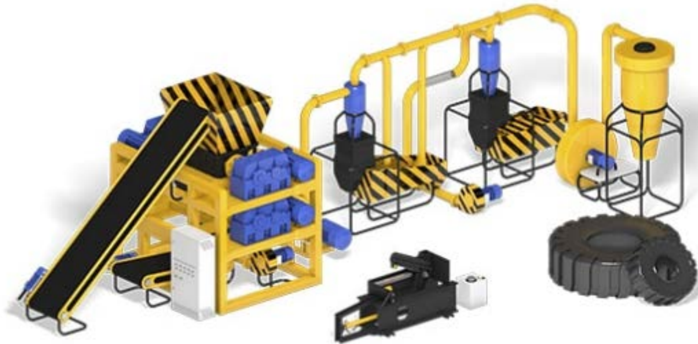
Пристрій для переробки шин RAPTOR SH-550 Classic