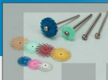
Радиальные круги 14 и 19 мм

Удаление окислов и финишная обработка мелкой трубки радиальной щеткой Scotch-Brite™ Bristle 25 мм, зерно 120