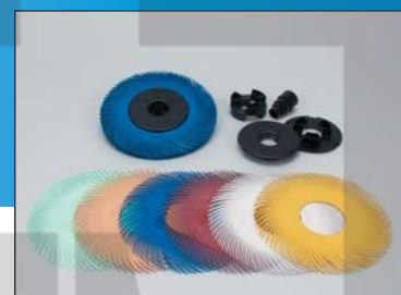
Радиальные щетки 150 мм, тип С