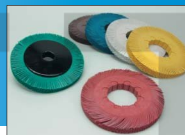
Радиальные щетки 200 мм, тип С и S