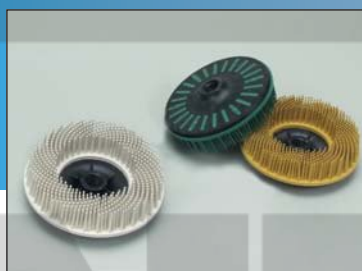
Зачистные круги 115 мм, M14