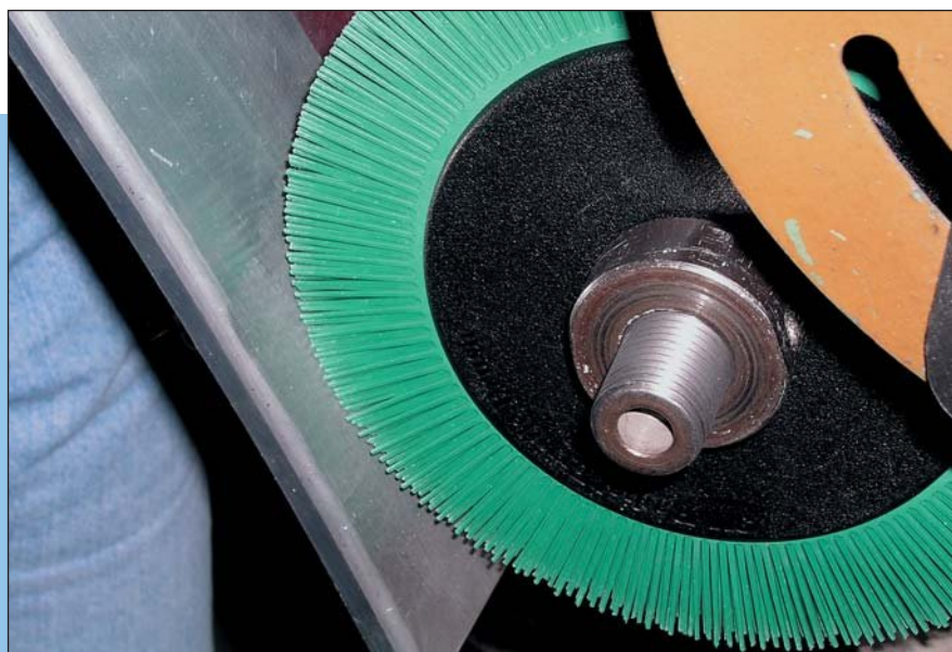
Обработка поверхности радиальной щеткой Scotch-Brite™ Bristle 200 мм, тип S

Щетки типа А диаметром 150 мм имеют прямые щетинки, которые расположены под углом, и предназначены для зачистных операций и удаления заусенцев.