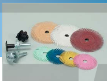
Радиальные круги 50 и 75 мм, тип С