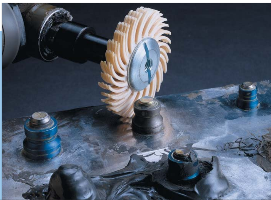
Удаление шовного герметика радиальной щеткой Scotch-Brite™ Bristle SR 50 мм

При работе обычными абразивами и скребками очень высок риск поцарапать обрабатываемую поверхность. При использовании радиальных кругов Scotch-Brite™ Bristle 360 и SPA вероятность повреждения поверхности существенно меньше, при работе инструмент легко контролируется, что обеспечивает удаление одного слоя краски за один раз. Гибкие щетинки работают на небольшой площади с существенно меньшим нагревом поверхности. Они легко повторяют форму детали и позволяют добиться действительно высокой однородности обработки.