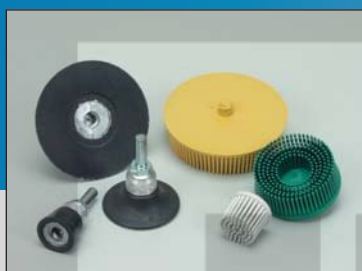
Зачистные круги 25, 50 и 75 мм, Roloc™

Достичь высокого качества обработки поверхности вы можете быстро и легко с помощью высокоскоростных кругов диаметром 25, 50 и 75 мм с креплением 3М™ Roloc™. Для работы не требуется больших усилий, эффективное удаление различных покрытий и загрязнений с поверхности металла происходит без повреждения детали.