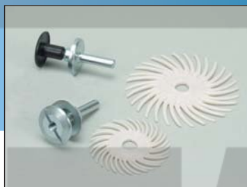
Радиальные круги SR