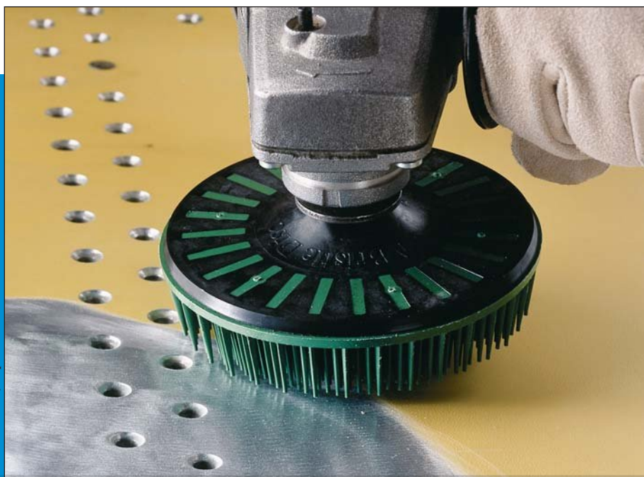
Удаление краски зачистным кругом Scotch-Brite™ Bristle 115 мм, зерно 50

Металлообработка • Любые ремонтные операции • Двигатели