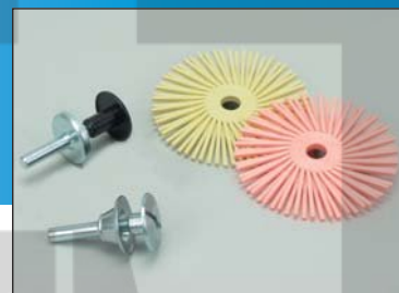
Радиальные круги 360 и SPA