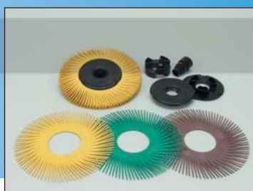
Радиальные щетки 150 мм, тип А