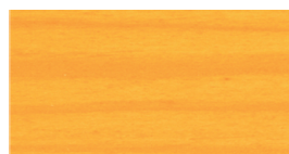
калужниця калужница / marigold