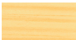
безкольоровий бесцветный / colorless