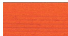
горобина рябина / rowan