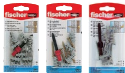
GK K GKS K GK WH K