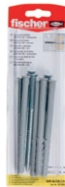
SXR 8 x 120 Z K