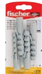
S 14 GK