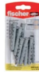
SXR 8 x 60 K