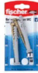
S 8 RD 80 K SA