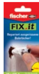
Ремонтная салфетка FIX.it