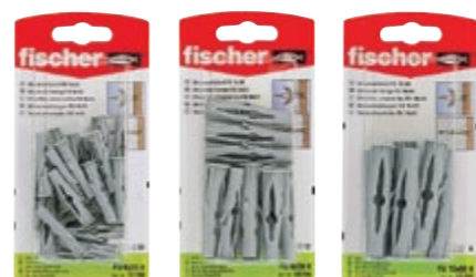
FU 6 x 35 K FU 8 x 50 K FU 10 x 60 K