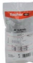
S 14 ROE 185