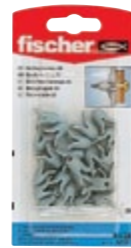
A 4 GK