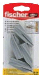
GB 8 K