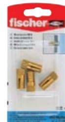
PA 4 M8/25 K