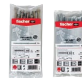
FUR 8 x 80 SS FUR 8 x 80 T