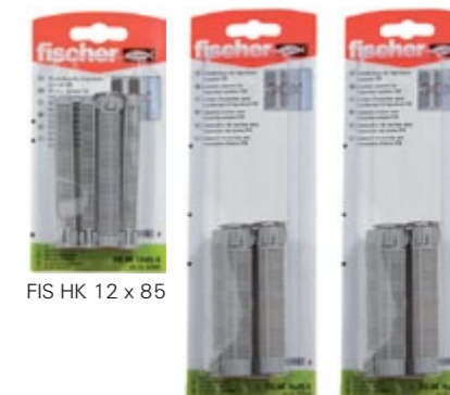
FIS HK 12 x 85