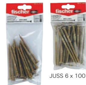
JUSS 6 x 80 B