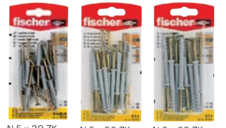
N 5 x 30 ZK N 5 x 50 ZK N 6 x 60 ZK