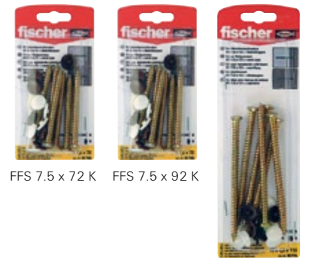
FFS 7.5 x 72 K FFS 7.5 x 92 K FFS 7.5 x 112 K