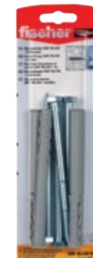
SXR 10 x 120 SS K