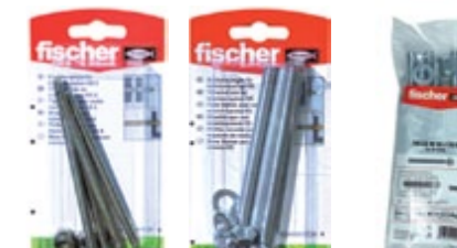
FIS GS M 6 x 110 K