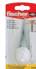
TS 8 W K