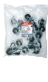
FGRS Plus 1/4" BG