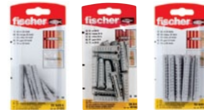
SX 6 x 50 K SX 8 x 40 K SX 8 x 65 K