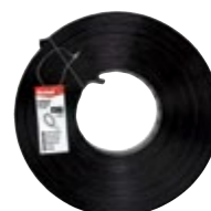
LBK 19/10 E