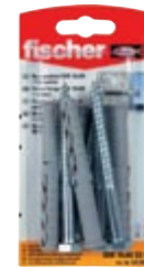
SXR 10 x 80 SS K