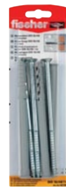
SXR 10 x 140 T K