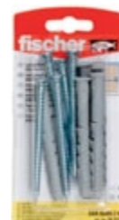
SXR 8 x 80 Z K