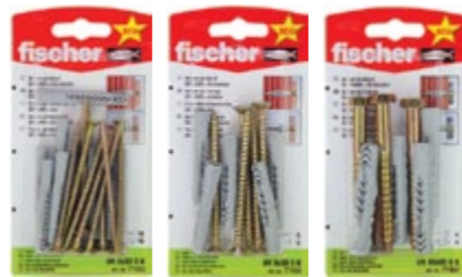
UX 6 x 50 SK UX 8 x 50 SK UX 10 x 60 SK