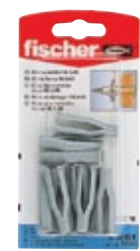
NA 8 x 40 К