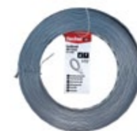
LBV 17/10 E