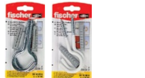
SX 10 x 50 HV K SX 10 x 50 HN K