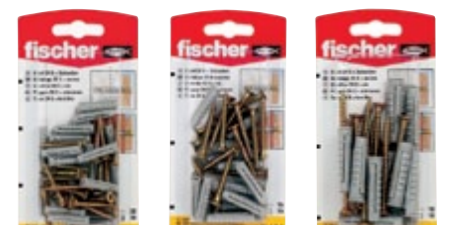
SX 5 x 25 SK SX 6 x 30 SK SX 8 x 40 SK