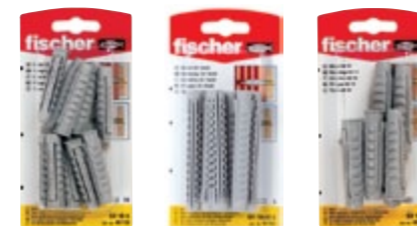
SX 10 x 50 K SX 10 x 80 K SX 12 x 60 K