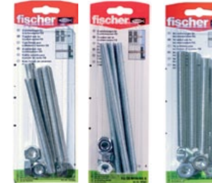
FIS GS M 8 x 120 K