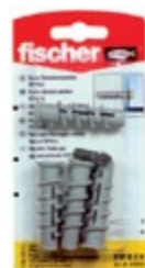
FTP K 6 K