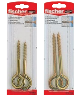
GS 8 x 80 K GS 8 x 100 K