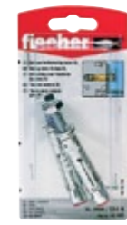
TA M 6 S/10 K