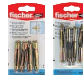
HM 6 x 52 SK HM 5 x 65 SK