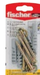
WL 7 x 60 K