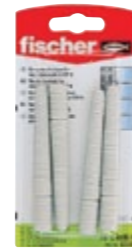
FIS EK 6 x 75 K