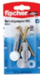
WC N K