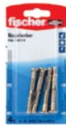
FNA II 6 x 30/5 S K