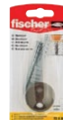
TS 8 BR K