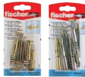
НМ 5 x 37 НК НМ 5 x 65 НК