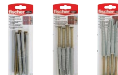
FUR 8 x 120 T K FUR 10 x 80 T K FUR 10 x 100 T K