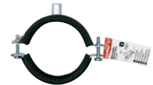
FRS Plus 3" E