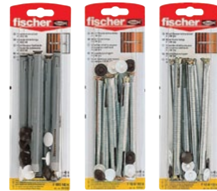
F 10 S 140 K F 10 M 112 K F 10 M 132 K