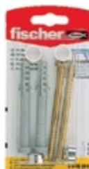
S 8 RD 80 K