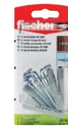
UX 8 x 50 WH K