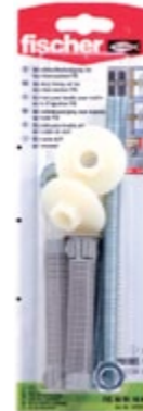
FIS WM10 K