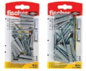
RB 6 x 30 K RB 8 x 40 K