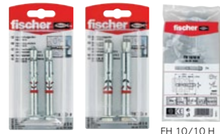
FH 10/10 SK