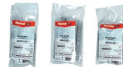
FIS HK 16 x 85 B