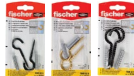
RHR 63 K RHM 63 K RHR 82 K