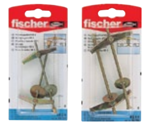
KD 3 К KD 4 К