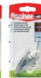
UX 8 x 50 WH N K