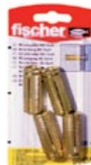
MS 12 x 37 K