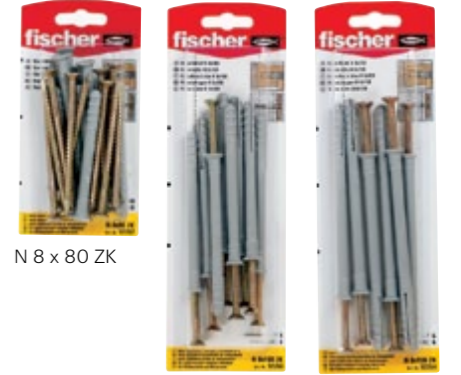
N 8 x 80 ZK N 8 x 100 ZK N 8 x 120 ZK