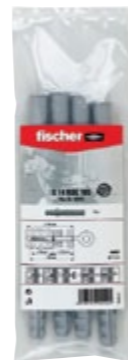
S 14 ROE 185