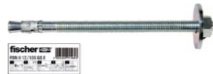
FBN 12/100 GS