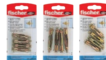
HM 5 x 37 SK HM 5 x 52 SK HM 6 x 37 SK