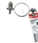
ES CU 1" E