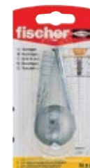
TS 8 G K