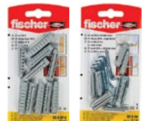
SX 8 x 40 KP K