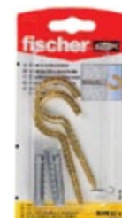
RHM 82 K