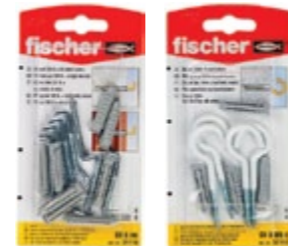
SX 6 x 30 H K SX 6 x 30 HR K