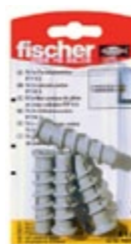
FTP K 4 K