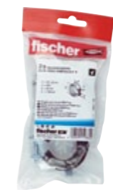
FGRS Plus 3/4" B