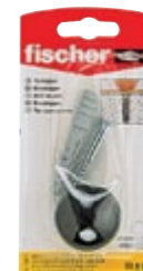
TS 8 S K