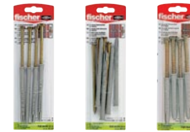
FUR 8 x 100 SS K FUR 8 x 120 SS K FUR 10 x 80 SS K