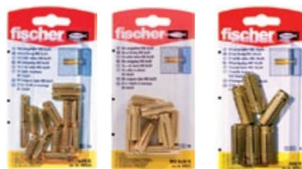
MS 6 x 22 K MS 8 x 28 K MS 10 x 32 K