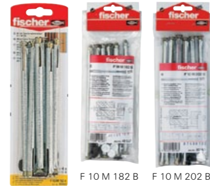
F 10 M 152 K F 10 M 182 B F 10 M 202 B