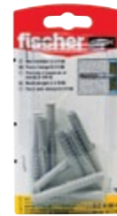
SXR 8 x 80 K