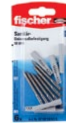
SB UX K