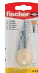
TS 8 BG K