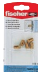
PA 4 M6/13.5 K