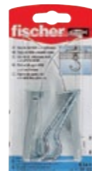
К 54 К