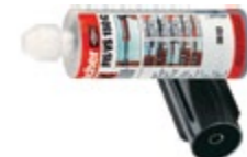
Инъекционный состав FIS VS 150 C , без стирала