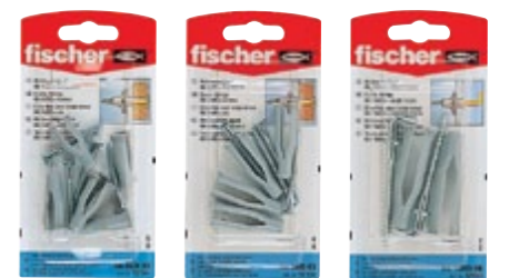
NA 8 x 30 KS NA 8 x 40 KS NA 10 x 55 НК