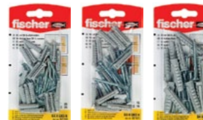
SX 5 x 25 GKS K SX 6 x 30 GKS K SX 8 x 40 GKS K