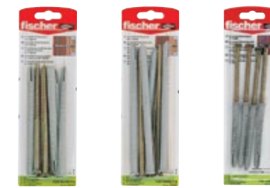
FUR 10 x 135 T K FUR 10 x 160 T K FUR 8 x 80 SS K