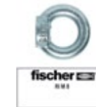
RI M 8