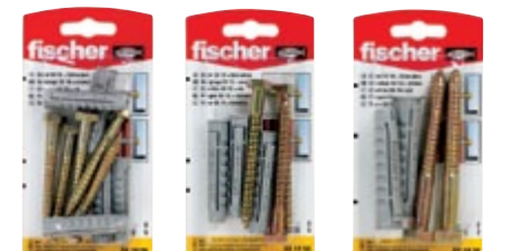
SX 10 x 50 SK SX 12 x 60 SK SX 14 x 70 SK