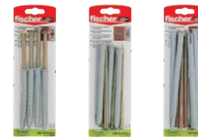
FUR 10 x 100 SS K FUR 10 x 135 SS K FUR 10 x 160 SS K