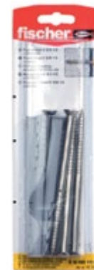
SXR 10 x 120 T K