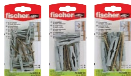
FU 6 x 35 SK FU 8 x 50 SK FU 10 x 60 SK