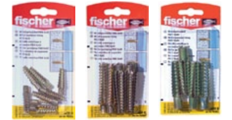
FMD 6 x 32 K FMD 8 x 60 K FMD 10 x 60 K