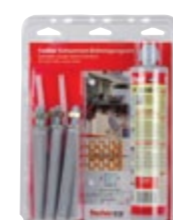
FIS P 300 T SBS