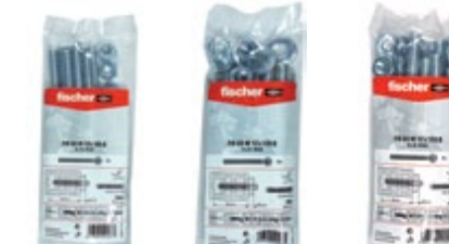
FIS GS M 10 x 165 B