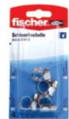
SGS 8-12 W1 K