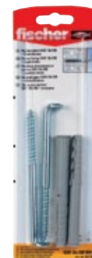
SXR 10 x 100 WH K