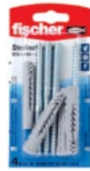
STS 8 x 100 + UX K