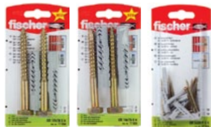
UX 12 x 70 SK UX 14 x 75 SK UX 5 x 30 RSK