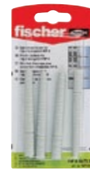
FIS EK 8 x 80 K