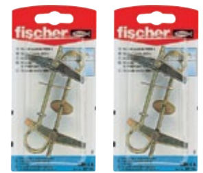
KDН 3 К KDН 4 К