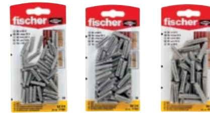
SX 4 x 20 K SX 5 x 25 K SX 6 x 30 K