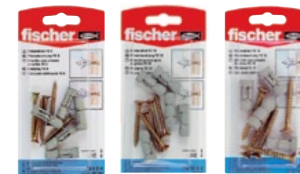
PD 8 SK PD 10 SK PD 12 SK