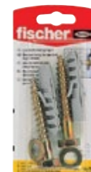
WL 10 x 70 K