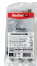
RG M 8 x 150