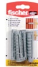
SX 14 x 70 K