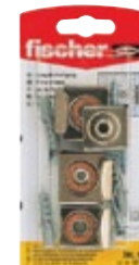
SKL M K