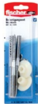
WST 10x140 K