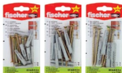
UX 6 x 35 RSK UX 6 x 50 RSK UX 8 x 50 RSK