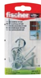
UX 8 x 50 RH K