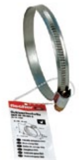
SGS 50-70 W1 E