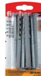
SXR 10 x 100 T K