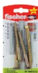
UX 10 x 60 RSK