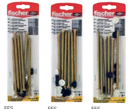
FFS 7.5 x 132 K FFS 7.5 x 152 K FFS 7.5 x 182 K