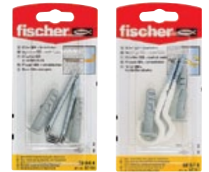
SB 8/6 K SB 8/7 K