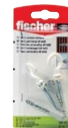
UX 8 x 50 RH N K