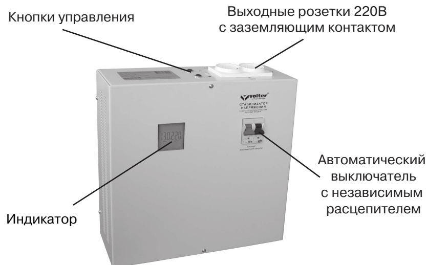
Рис.1. Стабилизатор (вид спереди)

Стабилизатор (рис.1) выполнен в металлическом корпусе прямоугольной формы, который позволяет эксплуатировать его как в настенном, так и в настольном варианте. Все функциональные узлы стабилизатора расположены на задней части корпуса и закрыты лицевой частью.